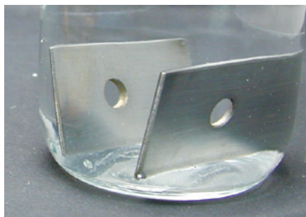
Eau déminéralisée + DIAPROSIM™ RD25 à 50 L / m 3